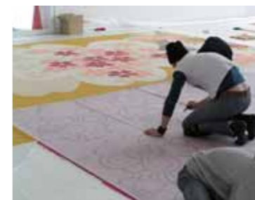
マイケル・リン《無題》制作風景

に見えるものが多いのですが、今回は数枚の布を縫ぎはいたようなイメージになっています。構想にあたりマイケル自身が独自に十和田市をリサーチし、地元工芸品、南部裂き織の「はぎれを組み合わせ一枚の布を作りあげる」という特徴に着想を得たものなどの事。休憩スペースは無料ゾーンになっています。気が向いた時、散歩の途中にでも、ふらっと立ち寄りみてください。アートの中でゆったりくつろぐ、そんな新しい空間が官庁街に生まれます。