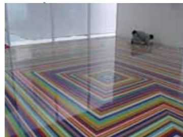
ジム・ランビー《Zobop》制作風景

は、床面などにテープを貼りめぐらせる独特の作品を「zobop」と名付け、様々な場所で発表してきましたが、展覧会などでは会期中限定設置が多く、美術館のような公共空間での恒久設置はこれが初めて。特殊な樹脂で表面をコーティングするために、表面に落ちた細かいダストを取り除くのはもちろん、指紋による曇りも綺麗に取り去ります。作品を傷めずに拭きあげるデリケートな作業が続きます。