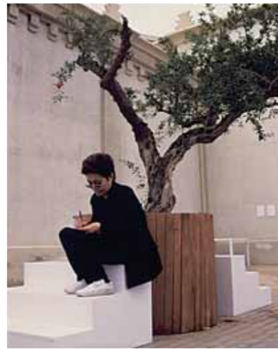
Yoko Ono installing "Wish Tree" EnTrance June 23 July 25, 1997 Lonja del Pescado, Alicante, Spain