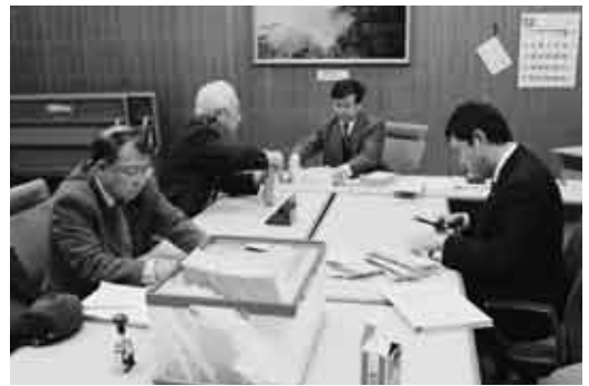
アンケートの開封作業