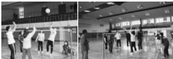
昨年、総合体育大会でのオープン競技の様子