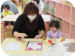
育児講座 「押し花体験教室」