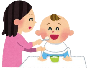
離乳食のすすめ方

子どもの成長とともに、悩みは尽きないものです。 保護者や家族の抱える悩みを相談してみませんか？