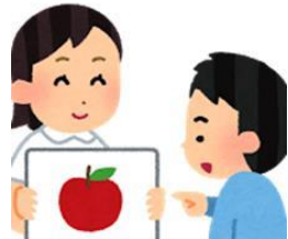
ことばや理解の遅れ