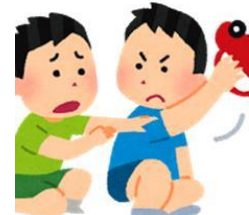
子ども同士のトラブル

さまざまな悩みや相談に応じて 子育てやしつけの方法、関わり方のアドバイスを行っています。 まずは気軽にご相談ください。