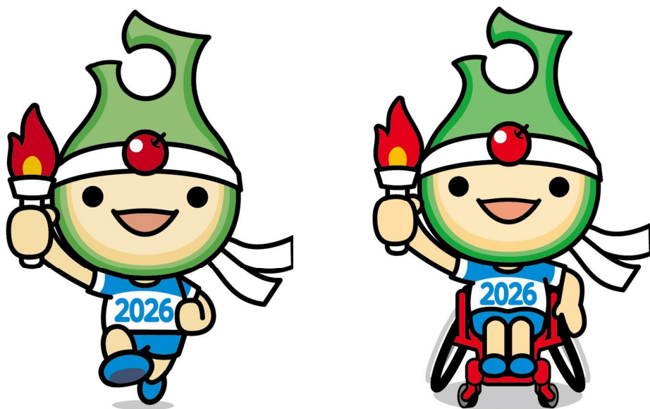
マスコットキャラクター アップリート君

青の煌めき きら あおもり国スポ・障スポ 2026 翔ける未来へ縄文の風に乗って 第80回国民スポーツ大会 第25回全国障害者スポーツ大会