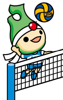
バレーボール(聴覚)