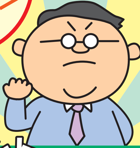
青森県健やか力 向上推進キャラクター 「マモルさん」