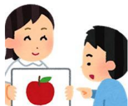
ことばや理解の遅れ