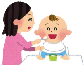
離乳食のすすめ方

子どもの成長とともに、悩みは尽きないものです。 保護者や家族の抱える悩みを相談してみませんか？