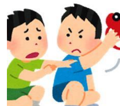
子ども同士のトラブル

さまざまな悩みや相談に応じて 子育てやしつけの方法、関わり方のアドバイスを行っています。 まずは気軽にご相談ください。