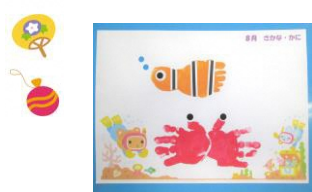
8月の手形・足形アートは「さかな・かに」