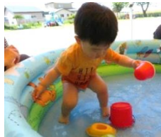
水遊び楽しみました