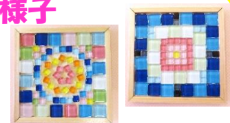
タイルクラフト『なべ敷きづくり』 すてきな鍋敷きができました。