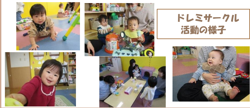
ドレミサークル 活動の様子