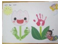
4月の手形・足形アート 「ちゅーりっぷ」