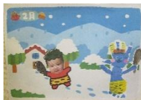
2月の手形・足形 アートは「まめまき」

ドレミルームは9:30~14:30まで開いています。 11:30で一旦さようならをします。 その後、お弁当を食べることもできます。 午後からの参加もできます。 (予約時に来園時間をお伝えください。)