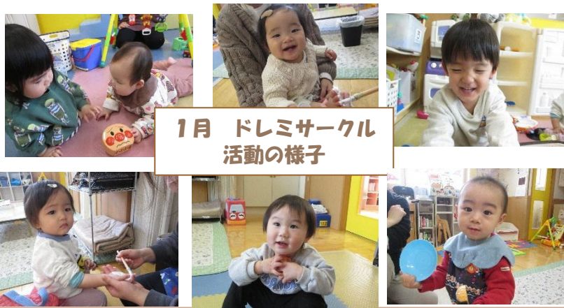
1月 ドレミサークル 活動の様子

★ドレミサークルでは当日の活動内容や予約状況をホームページでお知らせしています。ご予約はなるべくホームページからお願いします。