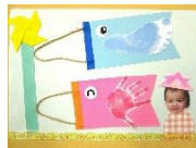
手形・足形アート 5月「こいのぼり」