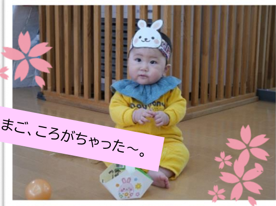
たまご、ころがちゃった〜。

十和田市の官庁街のさくらは本当に見事ですよね。散歩するみなさんを笑顔にしてくれています。子どもたちの笑顔を決やさないよう、優しく暖かい気持ちで関わりたいものですね。