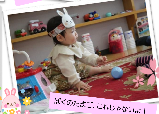
ぼくのたまご、これじゃないよ!