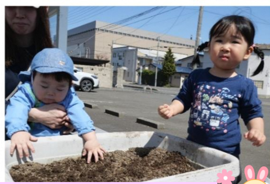
ほんとうにじゃがいもになるの?