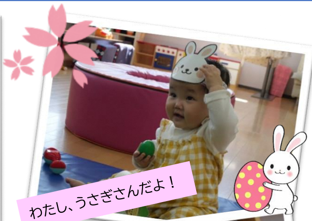
わたし、うさぎさんだよ!