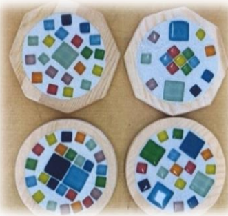
《作品はイメージです》

参加費: 300円 (お釣りのないようにご準備ください) 持ち物: 手拭き用ウエットティッシュ、エプロン