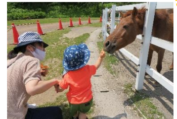
お馬さん にんじんどうぞ