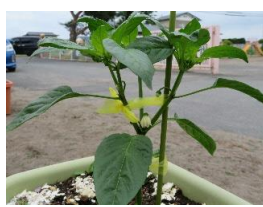
なす・ピーマンのお花も咲きました