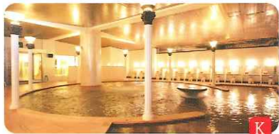
十和田莊酒店 Tel.0176-75-2221 15:00~21:00/成人500日圓、兒童300日圓

姬鱒的生魚片搭配罕見的魚卵堪稱極品。使用經十和田神社祈禱的白飯。 店名 伴手禮與餐飲商店 Morita 聯絡電話 Tel.0176-75-2206 時間 9:00-18:00(食堂11:00-15:00) 公休 冬季公休(12月~4月) 但1/1~1/5除外