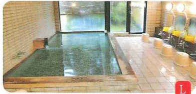
十和田湖 脈山亭 Tel.0176-75-2711 11:30~21:00/成人500日圓、國小生300日圓、國小入學前幼童200日圓