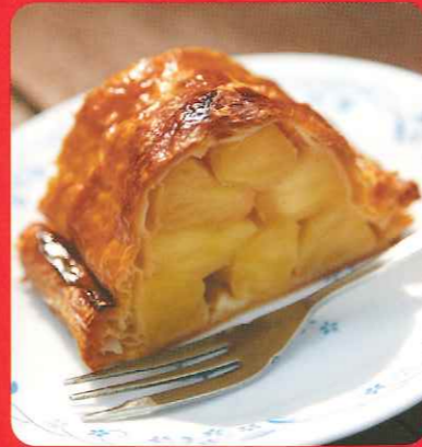
滿滿的愛 手工蘋果派

以手工用心製作的飯店蘋果派。 店名 十和田湖Marine Blue 聯絡電話 Tel.0176-75-3025 時間 8:00-18:00 公休 冬季公休(11月中旬~4月中旬)