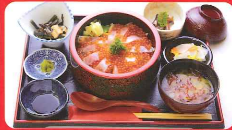
推薦的姬鱒料理 開運姬鱒親子蓋飯

對所有的生物心存感激,品嚐美味料理。享用時令與當地美食,為身心充飽電。經典的當地美食...生息於十和田湖的天然魚「十和田湖姬鱒」正以十和田品牌受到矚目。