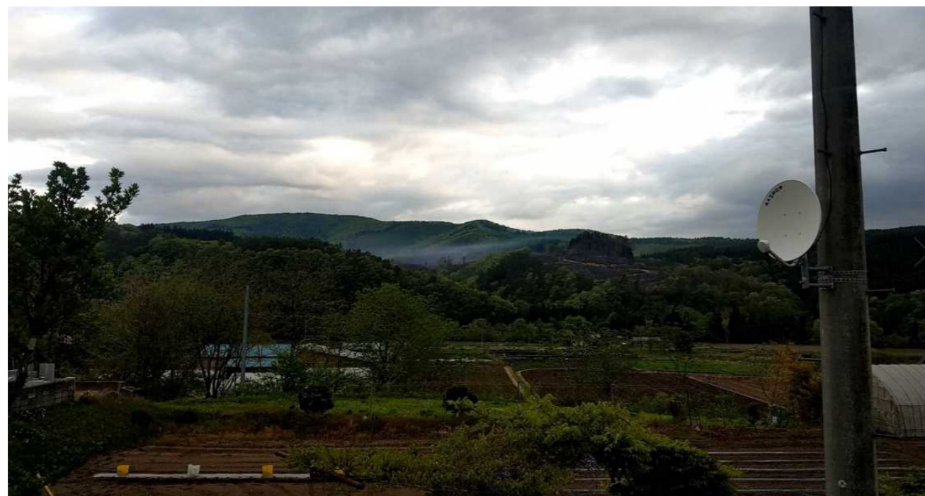
③【写真3】 5：20