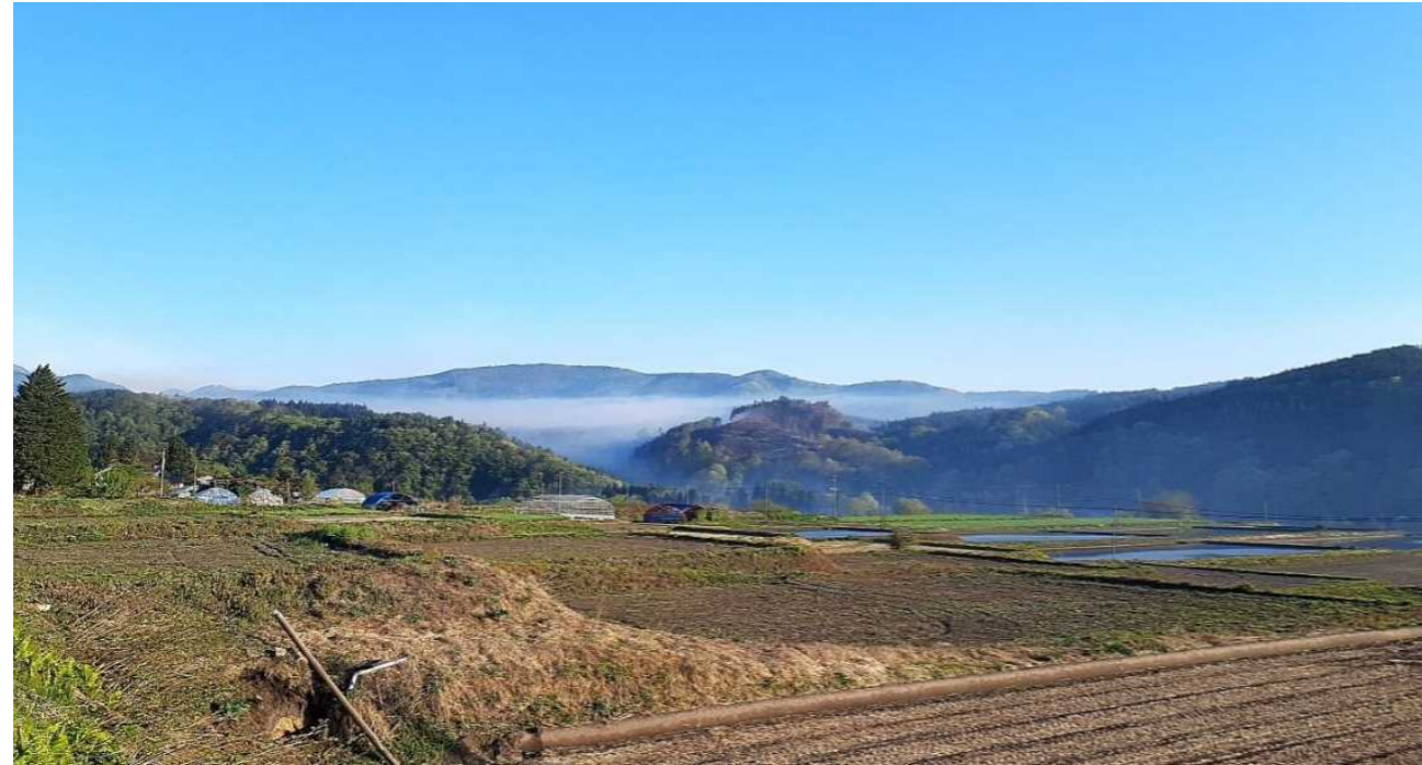
①【写真1】 5：45