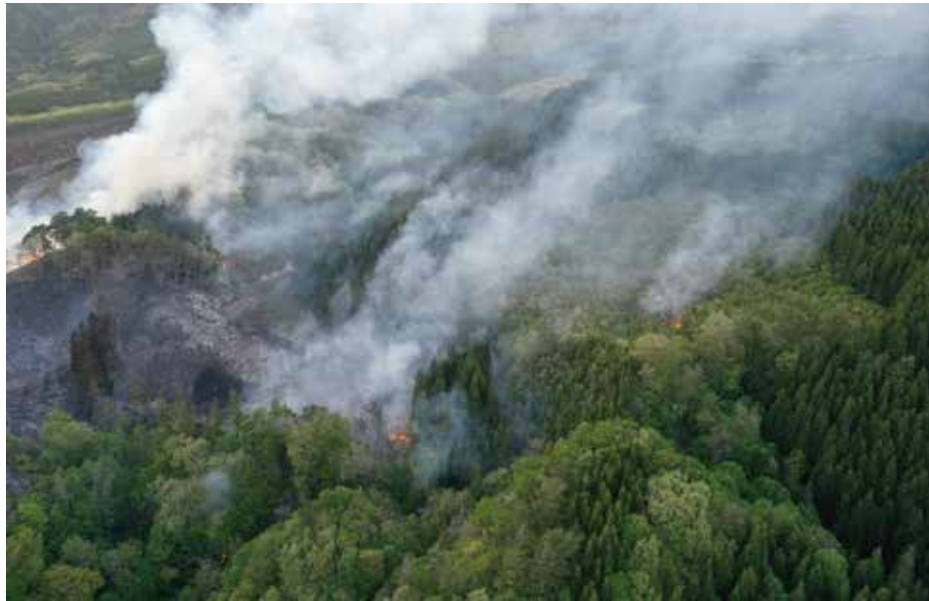
林野火災（大字法量夏間沢地区）の状況写真 （青森県防災ヘリ「しらかみ」から撮影）