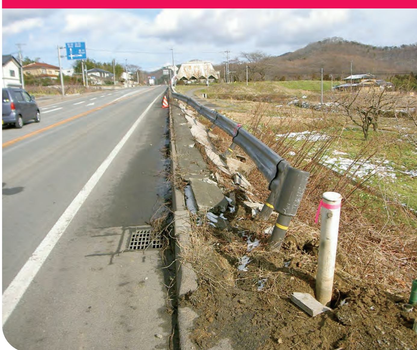
ガードレール・標識等の損傷