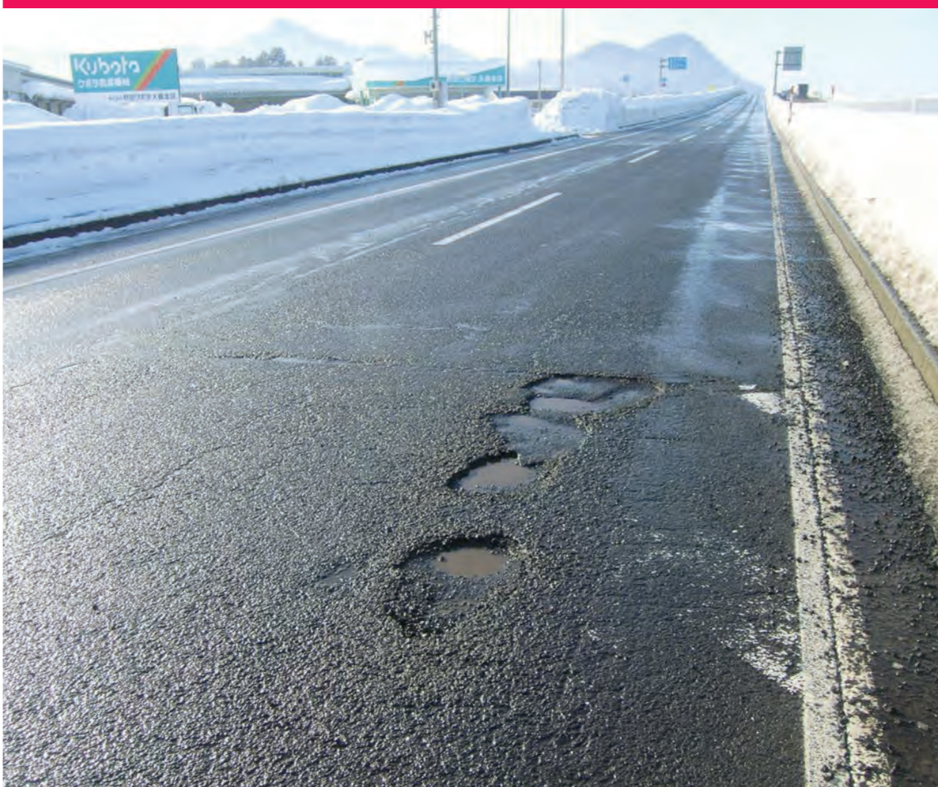
路面の穴ぼこ・段差