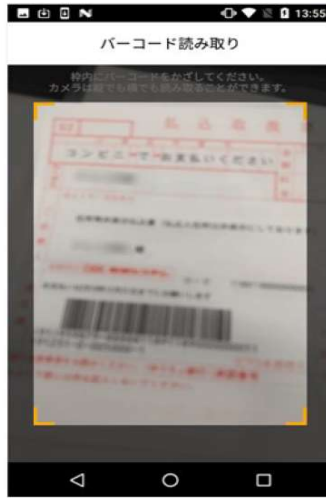
4. アプリからカメラを起動して 払込票のバーコードを読取