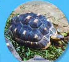
マダガスカルホシガメ