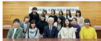
▲懇談会後の記念撮影