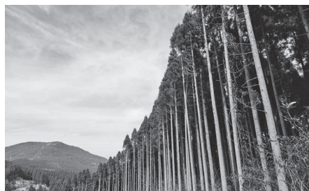
民有林伐採後の再造林率の向上を

農林商工部長 令和3年度は、人材と苗木の不足により、当初の予定より造林面積が半分