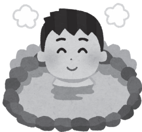
ふるさと納税返礼品への実現が期待される

議員 ふるさと納税 返礼品に市内温泉施設 を巡るフリーパス券の 提供など、体験型返礼 品を充実させては。 農林商工部長 複数の 事業者が一体となって 提供する体験メニュー を返礼品として造成す ることは難易度が高く、 さらなる課題解決が必 要となりますが、今後 提供できるよう検討し、 主体となり得る事業者 等に提案したいと考え ています。