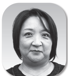
氣田量子 (自民公明クラブ)