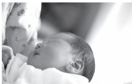
さらなる子育て支援の充実へ

令和4年度新規事業で、産婦健康診査、出産費用や股関節脱臼検査費用の助成、子ども医療費助成の対象者拡充などを予定しており、さらなる子育て支援を図っていきたいと考えています。