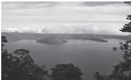
世界に誇る景観を有する十和田湖