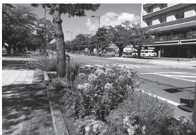
官庁街通りを彩る宿根草の花壇