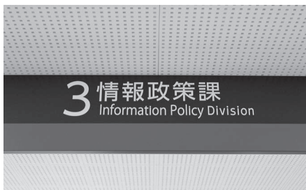
デジタル化推進のため新たにできた情報政策課

業務の効率化が求められており、市デジタル行政推進計画に基づき、各種施策の実現に向けて取り組んでいます。令和4年度は重点施策の一つに「デジタル化の推進」を掲げ、全庁的にデジタル化に取り組みます。