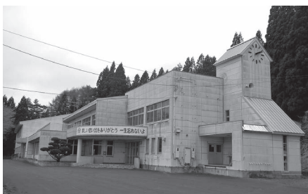
歴史と伝統ある旧滝沢小学校

議員 歴史と伝統あ る旧滝沢小学校の利用 状況と今後の活用は。 教育部長 体育館、グ ラウンドは住民要望を 受けて地域住民等によ る利用を許可しており、 交流やレクリエーショ ンの場として活用され ています。今後も要望 に応じ引き続き利用し ていきたいと思います。