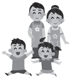
処遇改善が図られます

保育所、幼稚園等で働く保育士や幼稚園教諭等、仲良し会で働く放課後児童支援員や補助員等の処遇改善のため、令和4年2月分から給与を月額9000円程度引き上げるための措置を実施します。