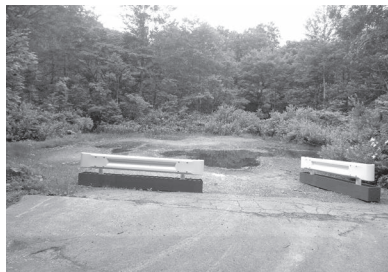
仙人橋付近の駐車場予定地

農林商工部長 令和4年度に赤沼周辺の登山道入口の仙人橋付近空き地を駐車場として整備し、登山道の運用は令和5年度からとなる見込みです。