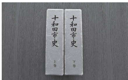
昭和51年に編さんされた十和田市史

議員 事業者が作成した環境影響評価方法書では、惣辺放牧場周辺が景観に配慮すべき主要な眺望点として設定されていないが、追加設定するよう提言する考えは。