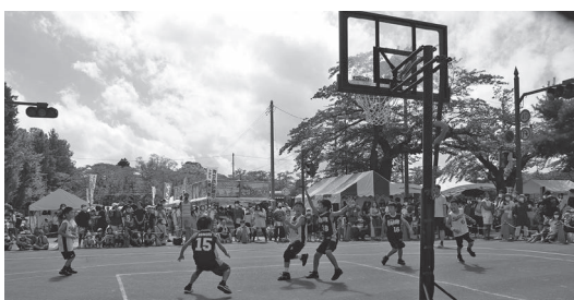
少人数で気軽に楽しめる3人制バスケットボール

答 1つの場所で複数の患者の診療を行うと単価は下がる仕組みだが、診療件数は増えているため、診療報酬の単価を下げないよう効率的な訪問診療を行う考えです。