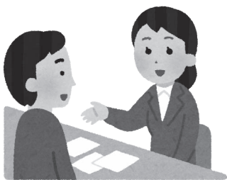
利便性が高いおくやみ窓口の設置を

民生部長 ワンフロアで手続きが完了する担当課の配置、チェックシートの活用、窓口番号案内システムの導入により、現時点では専用窓口を設置せずにご遺族への対応はできていると考えています。