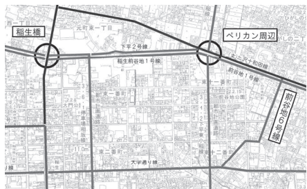
質問路線の位置図

議員 児童生徒がコロナで自宅待機した場合の対応は、1週間以上の自宅待機では、本人の実情に応じて電話等で定期的にコミュニケーションを取り、学校とのつながりを維持することに努めています。また、健康状態を確認