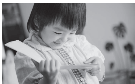
絵本を通じて健やかな成長を願う

議員 小さいうちから本に親しむことが大切だと考えるので、以前行っていた乳幼児健診の際に絵本をプレゼントする事業の復活を要望する。