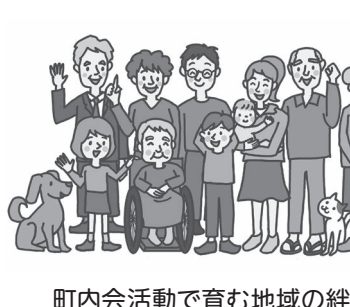
町内会活動で育む地域の絆

市長 転入者に町内会への加入を呼びかけるとともに、町内会への費用補助や、広域コミュニティの経費などの財政支援を行っています。