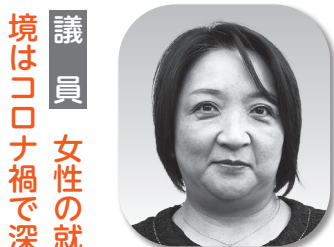
氣田量子 (自民公明クラブ)

建設部長 樹勢の衰えたものから順次更新する予定であり、保全地区等で後継木を育成しています。