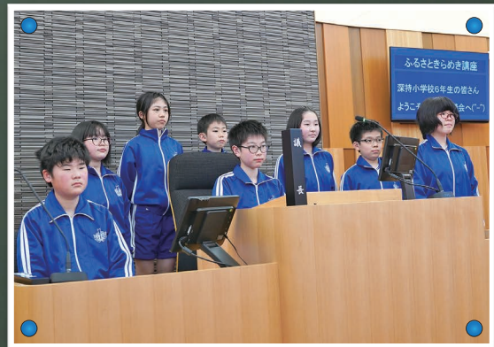
見学に来てくれた深持小学校の皆さん

四和小学校と深持小学校の6年生が議場の見学に来てくれました。議長席、議員席に座り、議員体験をしたり、事務局職員が講師となって議会の仕組み等について学びました。議会に関するクイズでは元気に手を挙げて答える姿も見られました。