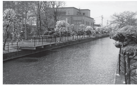
稲生川 ～郷土の歴史を後世に～

議員 今年3月から4月上旬にかけて芳川原浄水場の維持管理業務における入札に混乱が生じたようだが、その状況は。