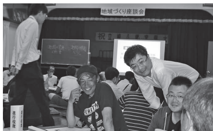
地域づくり座談会の様子

くことが困難な状況でした。今年度は機会を見て、松陽小学校区で設立に向けた支援や、北園小学校区を対象に地域づくり座談会を実施することにしていきます。その他地域も、広域コミュニティー形成に向けた取組を進め、地域住民が主体となる住みよいまちづくりを進めたいと考えています。