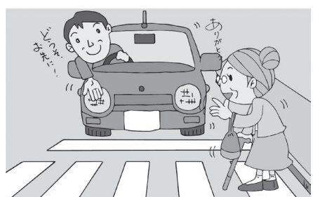
歩行者がいる場合は一時停止