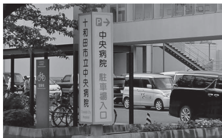
改善が図られた中央病院の案内板

病院事務局長 入り口にある照明付き案内板の点灯時間を夜8時までから明け方まで延長したほか、照明器具の交換、案内板前の桜の木の枝を剪定するなど、改善策を実施しました。新たな案内板の設置は現在検討していませんが、夜間救急等での来院者の必要性を見て対応していきます。