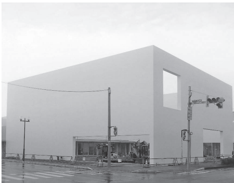
建設中の地域交流センター

無料（ただし、入場料、参加料、会費等を徴収して使用する場合等や、冷暖房、附属設備、備品類を使用する場合等は、使用料を徴収します。）