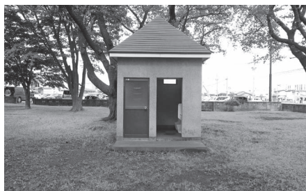
洋式化で利用しやすくなる八甲公園内トイレ