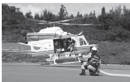
空中消火活動を行った防災ヘリコプター

して、人家への延焼も危惧されたため、翌10日午前6時に災害警戒対策本部を設置し、午前9時からの会議を含め、12日の火災鎮圧まで延べ5回の会議を開催し、様々な情報の共有、関係機関との協力、連携体制を整え、消火活動を指揮しました。 今回、林野火災は、焼損面積が新市となったため、 議員 不登校児童生徒のための中学校でのフリースクールを設置する考えは。 教育長 現時点で設置は考えていませんが、不登校児童生徒の気持ちに寄り添いながら、教育相談員の学校派遣、市教育相談室や適応指導教室の充実に努めたいと考えています。