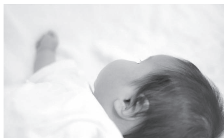
安心して産み育てられる環境を