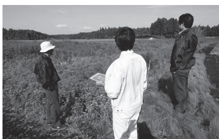
遊休農地パトロールの様子

農業委員会会長 委員等や委員の役割は法令等で示されており、日々の活動は活動日誌を作成することで見える化を進めています。そのため、現時点で条例を制定する考えはありませんが、農業経営体の減少や遊休農地の増加など、農地利用の課題解決に向けて、農業委員、推進委員が役割を果たしていくよう努めていきます。