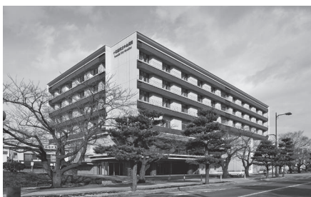
個人情報の適正な管理を

報は素早く処理する必要があるので各部署のシュレッダーは有効に活用しつつ、大量の紙カルテ等の処分にシュレッダー車の活用を検討しています。