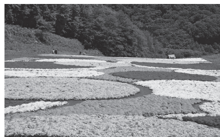
好評だった焼山のシバザクラ

議員 産後の母親は育児に追われ、食事のままならず、心身の回復に必要な栄養が十分に取れていない状況にあると感じるため、食事の配達サービスを導入しては、