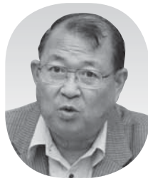
舛 甚 英文 (日本共産党)

へ異動になった職員の出援も受け、お客様の待ち時間を少しでも短縮できるように努めています。