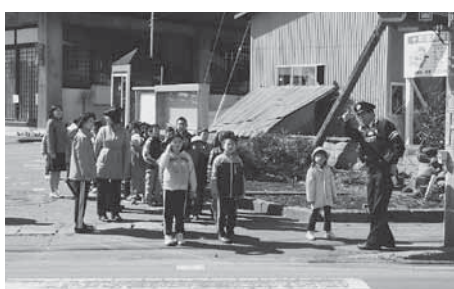
交通安全教室より