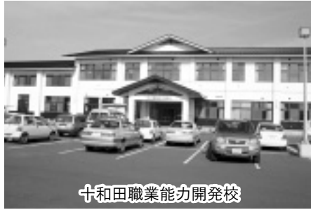
十和田職業能力開発校

また、新規高等学校卒業者の就職支援として、市長が直接経済団体や企業を訪問して雇用促進を要請しているほか、十和田地区雇用対策協議会及び職業安定所十和田出張所と連携し、就職相談会を開催するなど、早期の就職内定につなげるなどの対策をとっている。