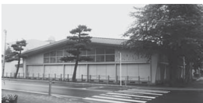
志道館は建てかえに