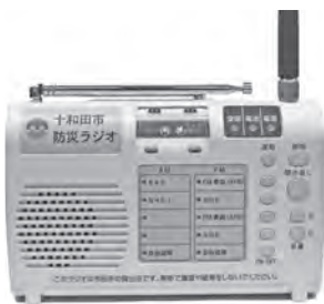
放送を聞き直す機能もある防災ラジオ

議員 同報系防災行政無線による8月10日の大雨警報の放送内容が分かりづらい、どう動いたらよいか判断