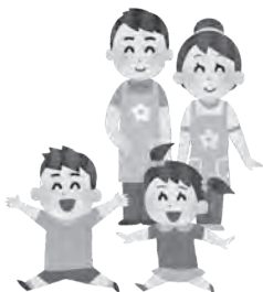
保育関連従事者にも慰労金の支給を

議員 網膜色素変性症の暗所視支援眼鏡の購入を補助する考えは、 市長 現在、規則に定める補助対象の日常生活用具の見直しを行っており、対象品目への追加を含め所要の改正を速やかに進めたいと考えています。