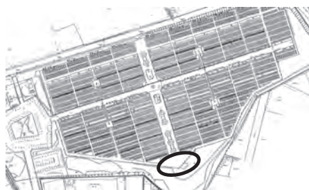
三本木霊園内の合葬墓建設場所

市長 8月に基本構想を策定し、年度内に測量調査と基本計画の策定を完了するよう進めています。その後は、令和4年度に設計、令和5年度に工事着手、令和6年度の供用開始を目指して整備を進めていきたく考えています。