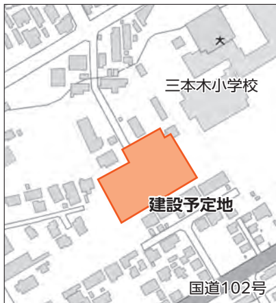
(仮称)瀬戸山団地【市民東プール跡地】

民間の資金と経営能力・技術力等を活用するPFI事業により老朽化が進む金崎A団地、金崎B団地、上平団地を集約し2か所に新たな市営住宅を整備します。今後、契約するために必要な事業費を設定しました。