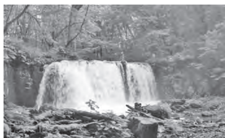
ふるさとのよさを感じ誇りに思う気持ちを

教育部長 昨年度までの地域資源を活用した体験学習等では、他者へ誇れる学校や地域にしたいという気持ちを高められました。今年度からはキャリア教育事業を実施し、ふるさと十和田を誇れる気持ちをより一層高めます。