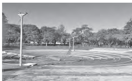
全国に誇る整備が期待される相撲場

教育長 9月1日の関係団体との意見交換会で、建設場所は現在地が妥当とされ、規模等は屋根の大きさや形など様々な意見を頂いています。今後さらに協議を深め、今年度末までに基本計画を策定したいと考えています。