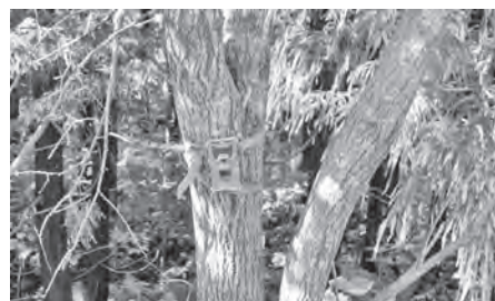
令和元年度に設置したセンサーカメラ

案の補助は機械を所有する地域や町内会しか手挙げができず、公平性の確保が困難なため、難しいと考えます。