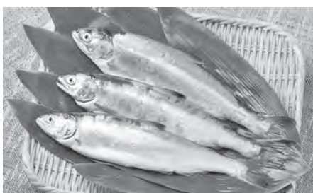
ブランド化が進む十和田湖ひめますの安定供給を

議員 宇樽部の廃船撤去に進展はあったか、 農林商工部長 桟橋の管理者は県のため、平成30年度から県に対する重点事業要望の中で撤去を求めており、法的措置も含めて検討していきたいとの回答を得ていますが、具体的な進展はありません。