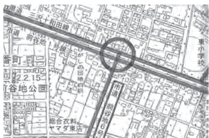
市道前谷地6号線を含む質問路線の位置図

今後は交通量調査や交通解析を実施し、設置が可能かどうか関係機関と協議していきたく考えています。