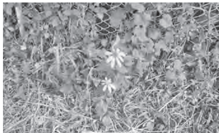
特定外来生物に指定されているオオハンゴンソウ

議員 地下に埋設された水道管の漏水や外壁等のコンクリートの亀裂など、老朽化した学校施設の調査にどう取り組んでいるのか。