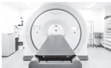
放射線治療の最先端であるトモセラピー

たばかりの現在は1日20件程度の利用で推移しています。治療再開と並行して、プレスリリースや、関係医療機関や医師会への紹介等について、今後は三沢市立三沢病院との連携による効率的な運用等で、医療の質の向上に貢献していきたいと考えています。