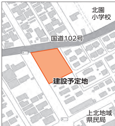
(仮称)北園団地【旧県西公舎用地等】