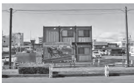
(仮称)公共交通拠点整備場所の旧亀屋跡地

農林商工部長 待合室等は民間事業者が隣接地に整備する複合施設内に設置される計画ですが、遅れる場合は市で臨時的に補完する可能性も含めて協議したいと考えています。 議員 ベニヤ板で仕切っている特別支援教室を改善できないか。