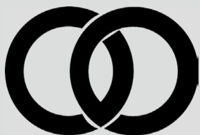
コミュニティシンボルマーク