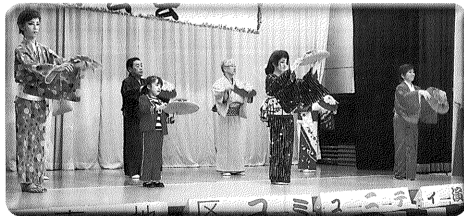
▲前回の演芸会から▲