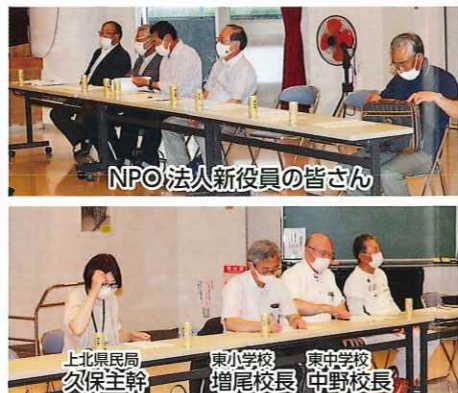
NPO法人ひがしの杜 設立総会会場