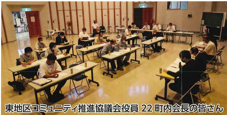
東地区コミュニティ推進協議会役員 22 町内会長の皆さん