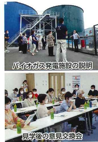
バイオガス発電施設の説明