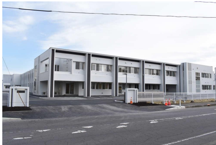
三本木中学校 外観

当該事業は、国庫補助事業である「学校施設環境改善交付金」、「学校教育施設等整備事業債」及び「公共施設整備基金」を活用し、実施します。