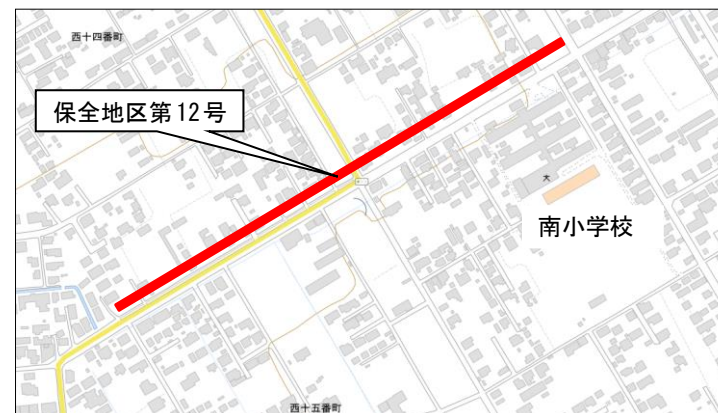
保全地区第12号 位置図