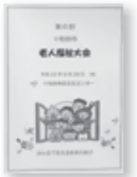
老人福祉大会プログラム