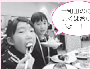
十和田のにんにくはおいしいよー！