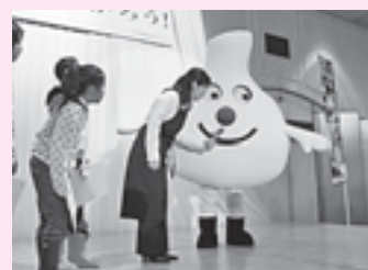
▲にんにく応援隊長のニンニクくんも登場