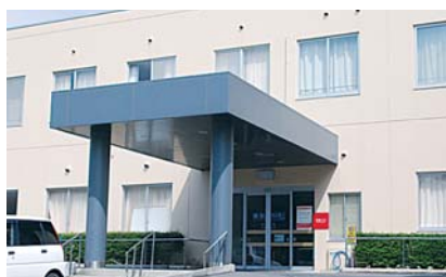
健診センターは中央病院西側、別館1階になります