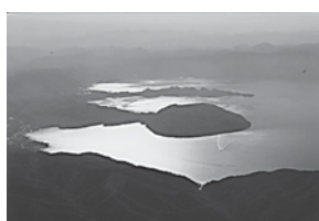
「天馬十和田湖を翔る」