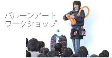
バルーンアートワークショップ

生涯学習出前講座とは、市民が講師として、団体が主催する集会などに出向き、講座を行うものです。