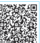
▲申し込みはこちらから