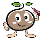
農林業センサスマスコットキャラクター「つつちー」