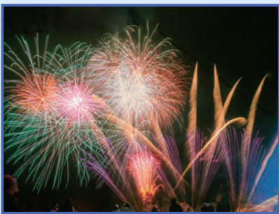
音楽と花火がシンクロした花火ショー