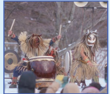
冬の国境(くにざかい)まつり

平成11年(1999年)に始まった「十和田湖冬物語」は、今年で第27回を迎えます。 美しい大自然の中で行われる各種アクティビティや、厳寒の澄んだ夜空を彩る音楽と 花火ショーで構成される十和田湖畔の冬季観光イベントをぜひお楽しみください。 ※荒天時は、日程・プログラムが変更になる場合があります。