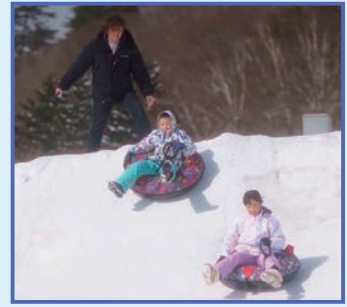
スノーアクティビティパーク