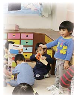
十和田市男女共同参画市民情報誌ゆっパル編集委員によるコーナーです

「ゆっパル」の由来 この地方の方言で「結ぶ」という意味の「ゆっばる」と、英語で「仲間・友だち」という意味の「パル」からできています。「一人ひとりの思いが結びついて仲間をつくる」という願いが込められています。