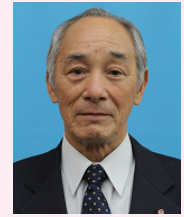
十和田市議会議長 竹島 勝昭