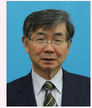
十和田市議会議長 畑山 親弘