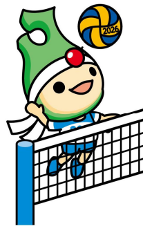
バレーボール(聴覚)