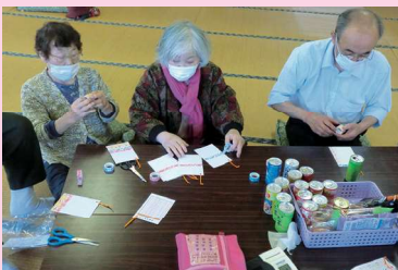
苦手なモノづくりにもチャレンジ！