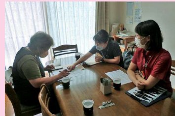
在宅介護支援センターハートランド、西南地域包括支援センターの方と一緒に立上げの打ち合わせを行いました。

地域の方への周知は、滝沢地域の中でも保健協力員がいない町内もあるので、自分の町内だけでなく、近隣の町内会長のところにも行ってサロン開催のチラシを配布しました。