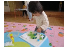
育児講座《ペーパークイリング》 すてきな作品が出来ました。