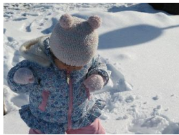
今年最初で最後の雪遊び 貴重な日となりました。