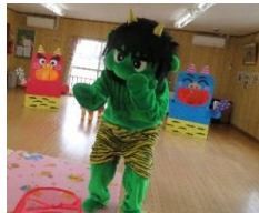
かわいい鬼に 興味深々