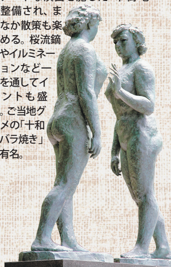
十和田湖畔に立つ乙女の像

市 の南西部に十和田湖、奥入瀬渓流を有し、八甲田山の麓には湯力自慢の温泉も点在している。また、十和田市現代美術館を中心にアートな演出を施した市街地も整備され、まちなか散策も楽しめる。桜流鏝馬やイルミネーションなど一年を通してイベントも盛ん。ご当地グルメの「十和田バラ焼き」も有名。