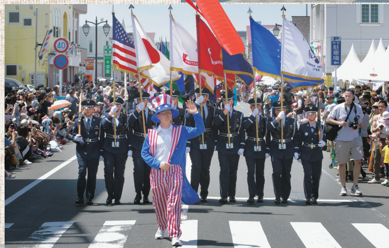
三沢アメリカンデーでのパレードが賑やか