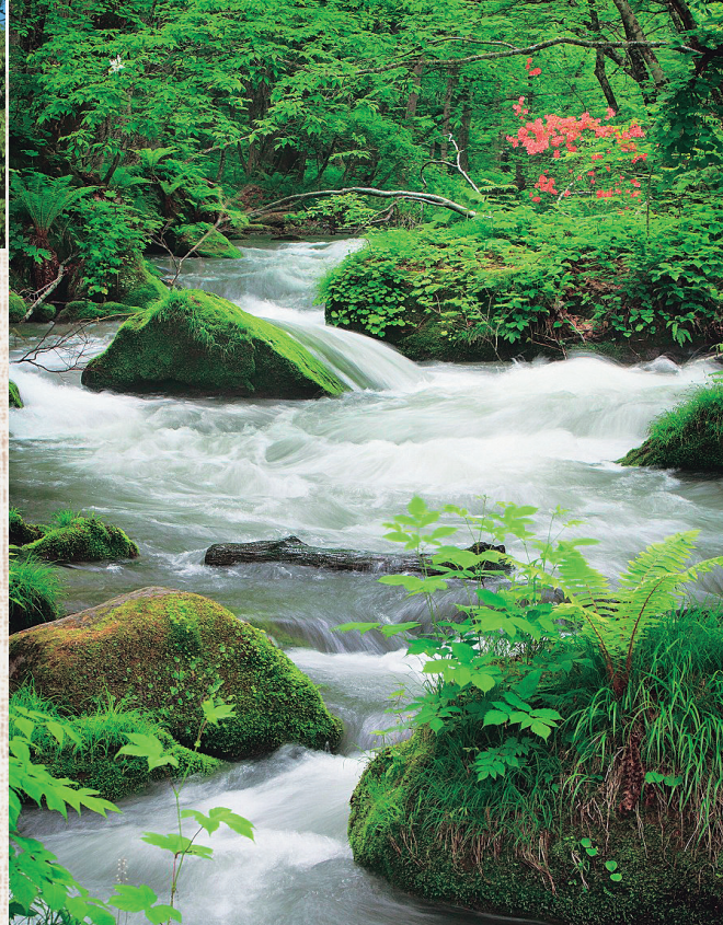
コケ散歩も楽しめる奥入瀬渓流。新緑は5~7月、紅葉は10月中旬~下旬が見ごろ

秋 田県北東部に位置し、十和田湖西岸を有するエリア。かつて鉱山の町として栄え、明治期に建てられたレトロな建物が今も残る。小坂鉄道レールパーク、康楽館、小坂鉱山事務所などモダンな観光スポットが点在。