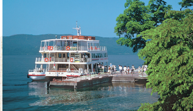
十和田湖では遊覧船も楽しみの一つ