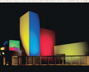
ライトアップされた夜の十和田市現代美術館。高橋匡太の『いろとりどりのかけら』

それぞれ個性的な10市町村で 連携する上十三は、 自然、文化、歴史にあふれた魅力的なエリア。 話題のご当地グルメや温泉とあわせて、 上十三の特徴をダイジェストに紹介しよう！