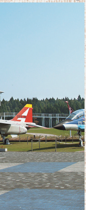
戦闘機などを展示した三沢大空ひろば