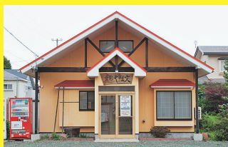
パイカの名物料理を食べられる店

●三沢市下久保57-182 ☎青い森鉄道三沢 駅から車で10分 ☎17時30分~22時 ☎不 定休 ☎10台